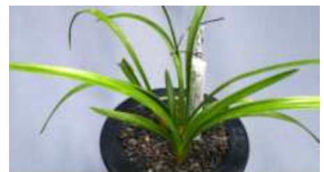
(商品番号) 1277 雄美 (四季春花、「滝山×幾島」) 6~18cm, 2~4枚葉, 4条立 (S14×4) 花芽1ヶ付き ¥ 80,000-