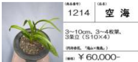
(商品番号) 1214 (品種) 空海

3~11cm, 3~5枚葉, 3条立 (S11×4) (四季春花、「滝山×幾島」) (価格) ¥ 70,000-