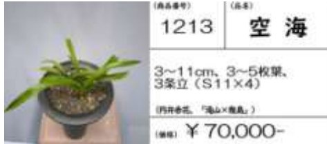
(商品番号) 1213 (品種) 空海

3~11cm, 3~5枚葉, 3条立 (S11×4) (四季春花、「滝山×幾島」) (価格) ¥ 70,000-