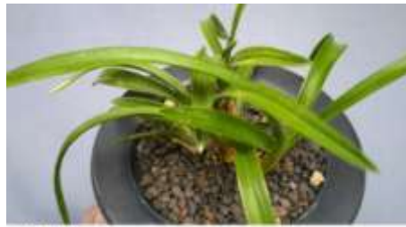
(商品番号) 1212 空海 (品種) (四季春花、「滝山×幾島」) 2~14cm, 2~5枚葉, 5条立 (S14×4) ¥ 150,000-