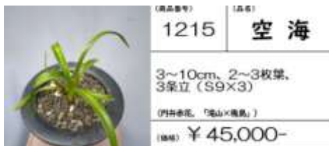
(商品番号) 1215 (品種) 空海

3~10cm, 3~4枚葉, 3条立 (S10×4) (四季春花、「滝山×幾島」) (価格) ¥ 60,000-