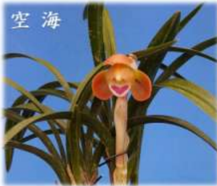
(商品番号) 1216 (品種) 空海 4~9cm, 2~3枚葉, 2条立 (S9×3) (四季春花、「滝山×幾島」) (価格) ¥ 35,000-

3~10cm, 2~3枚葉, 3条立 (S9×3) (四季春花、「滝山×幾島」) (価格) ¥ 45,000-