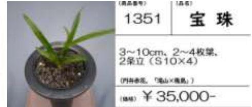
(商品番号) 1351 (品種) 宝珠

3~10cm, 2~4枚葉, 2条立 (S10×4) (四季春花、「滝山×幾島」) (価格) ¥ 35,000-