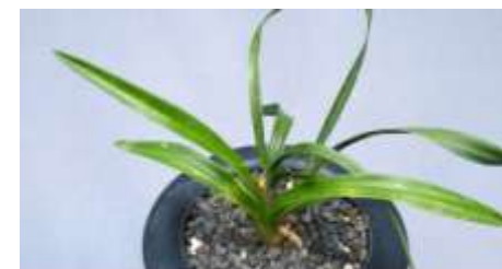
(商品番号) 1242 皇玉

(春花、「紅蓮」の愛育苗) 5~12cm, 2~4枚葉, 3条立 (S10×4) ¥ 40,000-