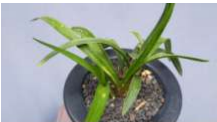
(商品番号) 1241 皇玉 (春花、「紅蓮」の愛育苗) 2~15cm, 2~4枚葉, 5条立 (S8×4) ¥ 55,000-