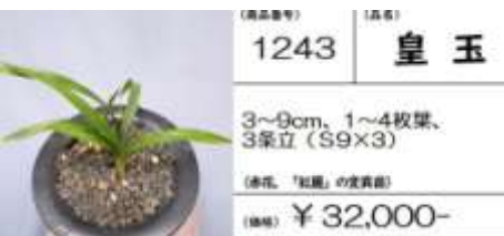
(商品番号) 1243 (品種) 皇玉

(春花、「紅蓮」の愛育苗) 5~12cm, 2~4枚葉, 3条立 (S10×4) ¥ 40,000-