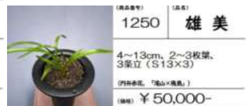
(商品番号) 1250 (品種) 雄美

4~13cm, 2~3枚葉, 3条立 (S13×3) (四季春花、「滝山×幾島」) (価格) ¥ 50,000-