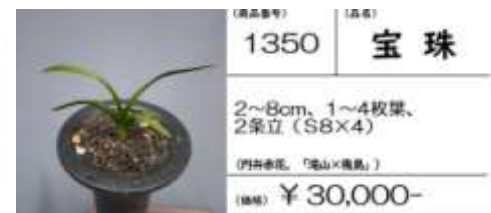
(商品番号) 1350 (品種) 宝珠

3~10cm, 2~4枚葉, 2条立 (S10×4) (四季春花、「滝山×幾島」) (価格) ¥ 35,000-