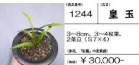
(商品番号) 1244 (品種) 皇玉

3~9cm, 1~4枚葉, 3条立 (S9×3) (春花、「紅蓮」の愛育苗) (価格) ¥ 32,000-